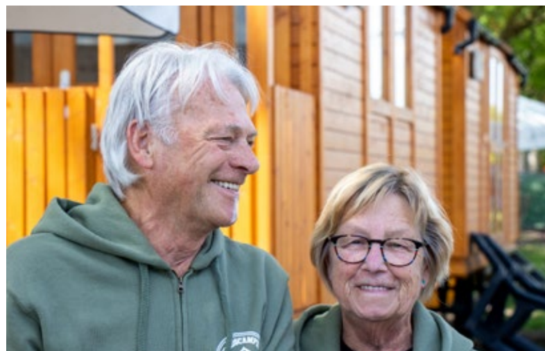
Jeeke en Peer