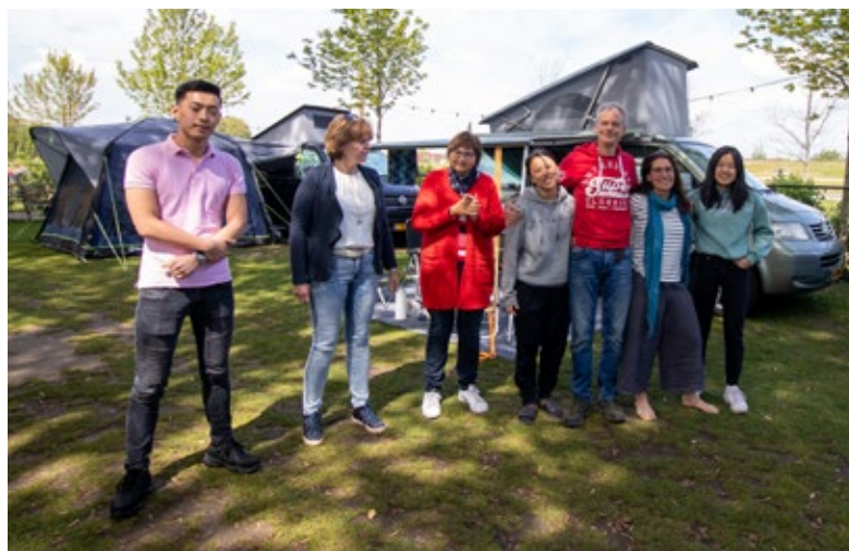
Speciale 'familie' reünie