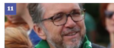
11 Nieuwe omgevingsmanager in de Noordhoek