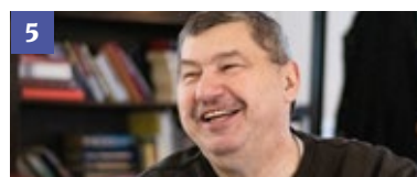
5 De gezichten achter de vrijwilligers